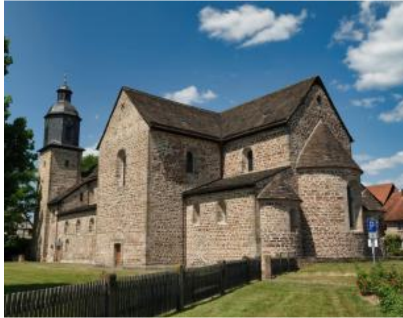
Klosterkirche Lippoldsberg - einer von aktuell 76 Orten auf www.weserbergland-regional.de .

■ Hofgeismar 01.01. - 31.12. (Mi & So) Genuss, Pillen und Pülverchen 300 Jahre Apothekengeschichte (Apothekenmuseum) ▶