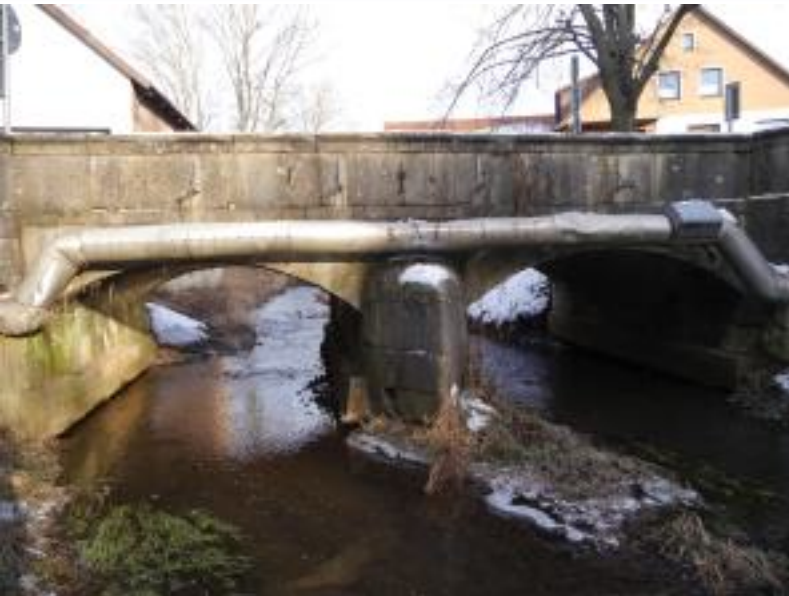
Die historische Brücke am 27.01.2017