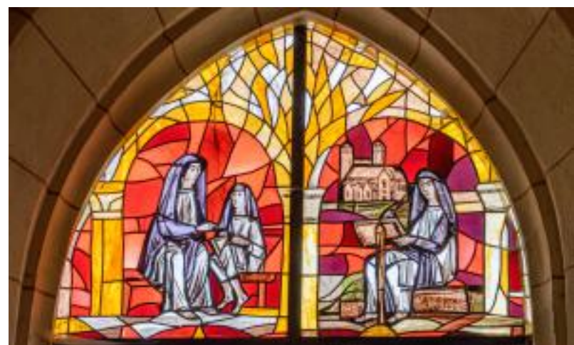
Das Roswitha-Fenster in der Stiftskirche Bad Gandersheim erinnert an Roswitha von Gandersheim, die erste namentlich bekannte deutsche Dichterin.