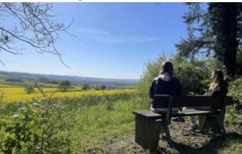
Kriegerdenkmal in Bartshausen | Panoramaweg