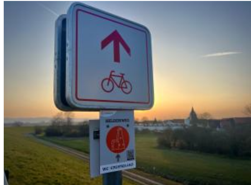
Leinepolder / Heldenweg

Kompakter, aber ebenso reizvoll, ist der Heldenweg in Salzderhelden. Die rund fünf Kilometer lange, familienfreundliche Rundwanderung verbindet Natur, Geschichte und schöne Ausblicke auf besonders zugängliche Weise. Los geht es am Parkplatz an der Saline Salzderhelden. Schon