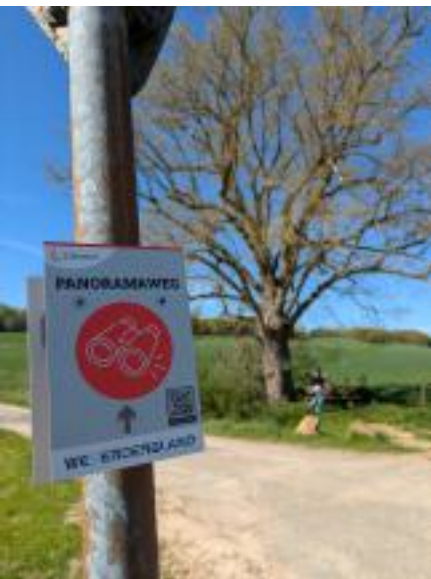
Alte Linde in Avendshausen | Panoramaweg

(Text: Erik von Petersson, Stadt Einbeck & Fotos: Einbeck Tourismus; Kriegerdenkmal & Krimi-Trail, CCO: Alte Linde & Leinepolder)