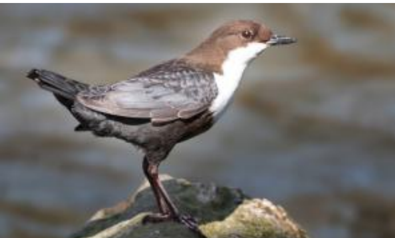
Wasseramseln an der Lenne