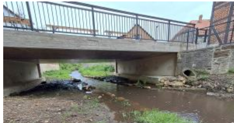
Die neue Brücke