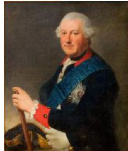
Herzog Carl I.