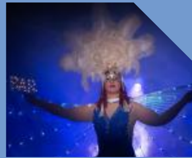
Vergessene Kreaturen Hann. Münden