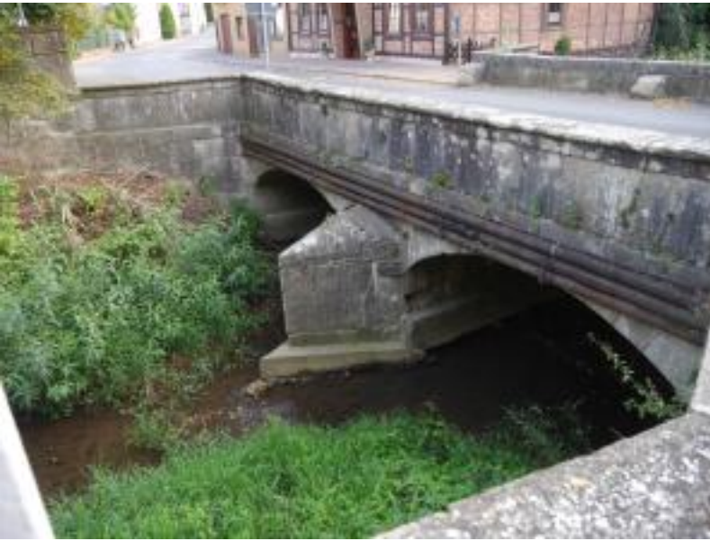
Die historische Brücke am 03.09.2018