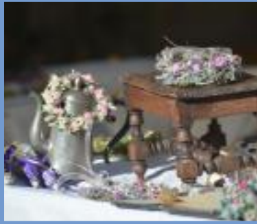
Bauern- & Kreativmarkt Neuhaus