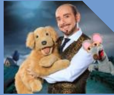
dolce vita Lauenförde