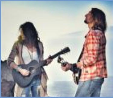
Birds of a Feather Lüerdissen

...mit mehr als 150 kostenfrei gemeldeten Veranstaltungen kostenlos